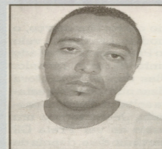
Alamir: acusado de homicídio

daram o suspeito na esquina das avenidas São Francisco e Conselheiro Nébias. Ao ser pesquisado foi constatado que era foragido do Centro de Progressão Penitenciária (CPP) Rubens Aleixo Sendim, em Mongaguá, desde 28 de fevereiro.